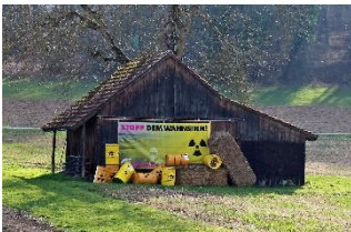
Atom Müllfässer an der Bahnlinie

(Matthias Edler, Atomexperte Greenpeace Deutschland)